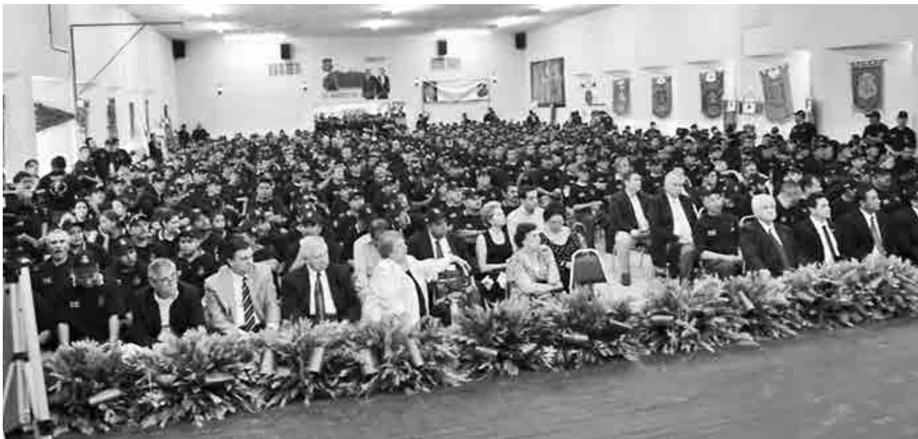
Concurrida asamblea en memoria de Don Napoleón Gómez Sada.

Fueron 4 décadas en las que con el apoyo y la lealtad de los afiliados, convirtió al Sindicato Minero en la gran Organización Sindical que hoy es ejemplo de lucha incansable ante propios y extraños, así como pieza fundamental de las estructuras de trabajadores más importantes del mundo.