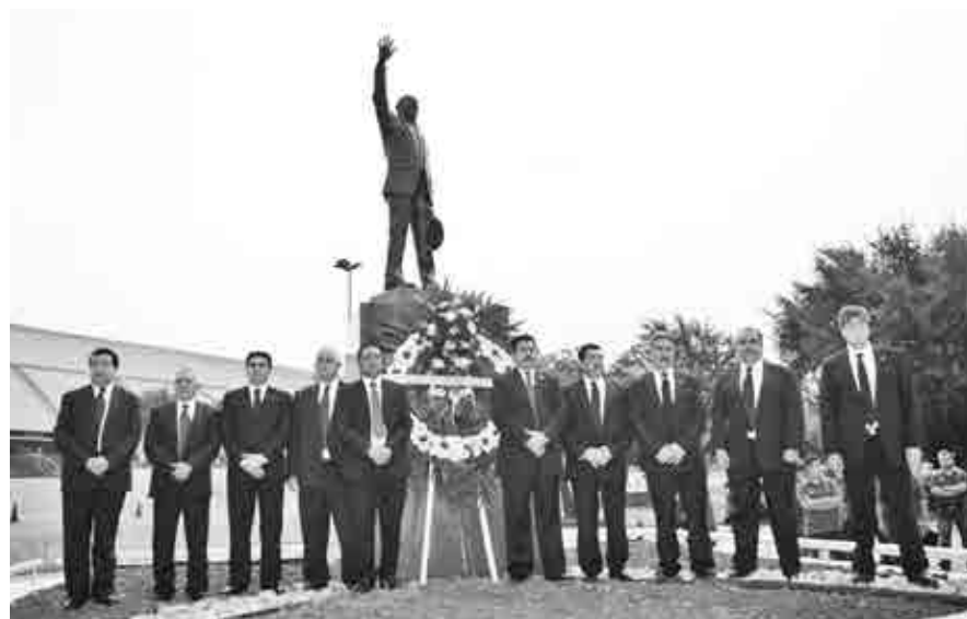
Con guardia de honor, integrantes del Comité Ejecutivo Nacional Minero rinden tributo a la memoria de Gómez Sada.

En esta asamblea, Napoleón Gómez Urrutia, Presidente y Secretario General del Sindicato Nacional