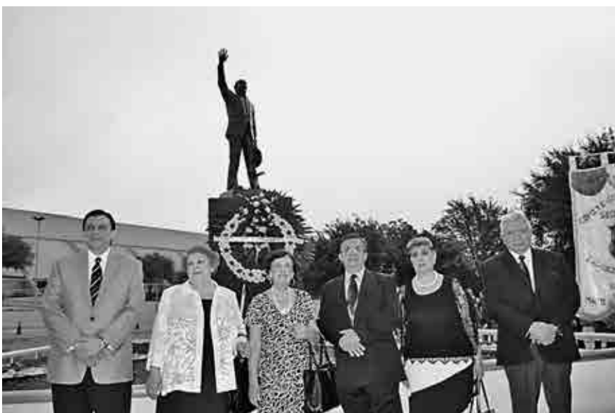
Guardia de la familia Gómez Urrutia

E n una emotiva y respetuosa jornada de homenaje que empezó a las 8:30 horas del sábado 11 de octubre, se rindió tributo a la memoria de Don Napoleón Gómez Sada. A esa hora, ante el monumento con el que se recuerda su personalidad, erigido en el Parque Fundidora de Monterrey, Nuevo León, familiares y miembros de Sindicato Nacional de Mineros del país depositaron ofrendas florales y recordaron la labor que, incesantemente, durante 40 años, desarrolló al frente de nuestro Organismo Sindical.