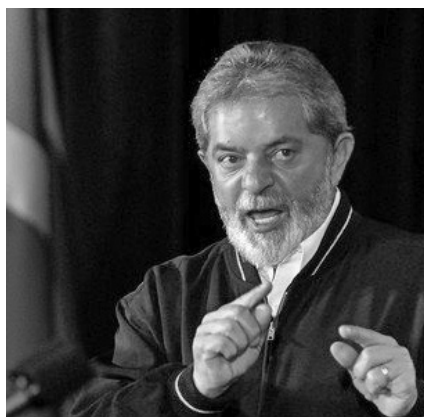
Luiz Inacio Lula da Silva, nacionalismo.

Este Sindicato ha venido siendo perseguido políticamente desde el 2006 por su defensa de la autonomía e independencia. A pesar de ello, ha mantenido en alto sus banderas y ha postulado la necesidad de un cambio radical de modelo económico y social, que supere al actualmente imperante de alta concentración de la riqueza y gigantescas desigualdades sociales.