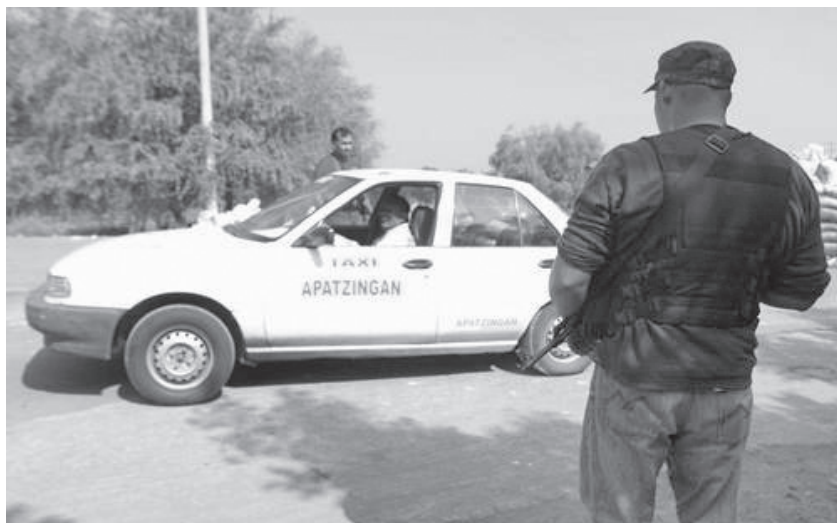
Cuota por paso.

cano, al hacer el listado de sus fuentes de financiamiento.