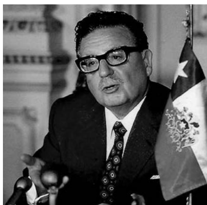
El golpe de Estado en Chile, experimento del modelo neoliberal.

Los Mineros de México, por el contrario, han estado y están permanentemente en la primera línea de la independencia obrera respecto de las empresas y del poder público. Por ello en los tiempos de los gobiernos conservadores de Vicente Fox y Felipe Calderón han sido atacados con el designio de desaparecerlos o que se sometieran, sin haberlo conseguido. Si en México alguna organización sindical se ha mantenido autónoma ha sido el Sindicato Nacional de Mineros.