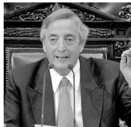
Néstor Kirchner, reversión.

Lo vivido por México en los últimos 20 años de vigencia del Tratado de Libre Comercio de América del Norte es muy negativo. La única salida a esta situación de retroceso provocada por el TLCAN es que se cambie el actual modelo económico, neoliberal, y se inicie el nuevo camino de una estrategia de desarrollo económico y social que privilegie las demandas nacionales y populares y deje atrás los esquemas de una infame distribución desigual de la riqueza. 🌐