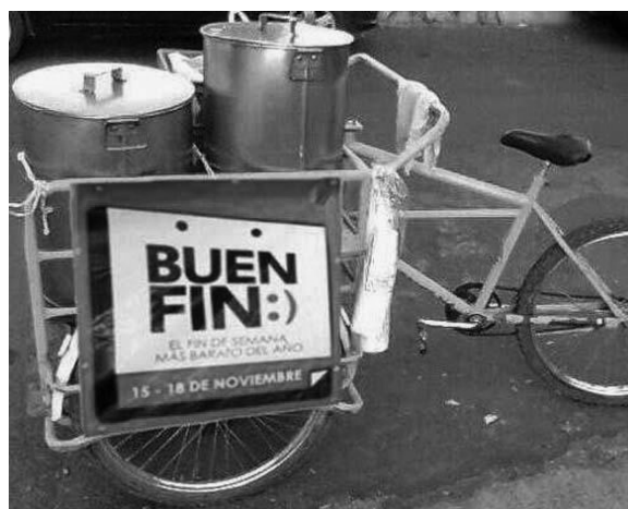
En 20 años de TLCAN, en México creció más el empleo informal que el formal.

► No decir más de lo que haga falta, a quien haga falta y cuando haga falta.