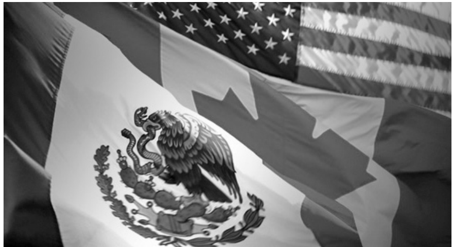
México, Canadá y Estados Unidos, una sociedad comercial que no es pareja.

El TLCAN surgió en la década de los 80 del siglo anterior, con el antecedente del llamado Consenso de Washington entre diversos países altamente desarrollados, como forma de oponerse y combatir el entonces creciente poderío político de la Unión Soviética y el llamado Campo Socialista. Esto es, como una forma de reaccionar las potencias capitalistas ante el avance del socialismo en el mundo.