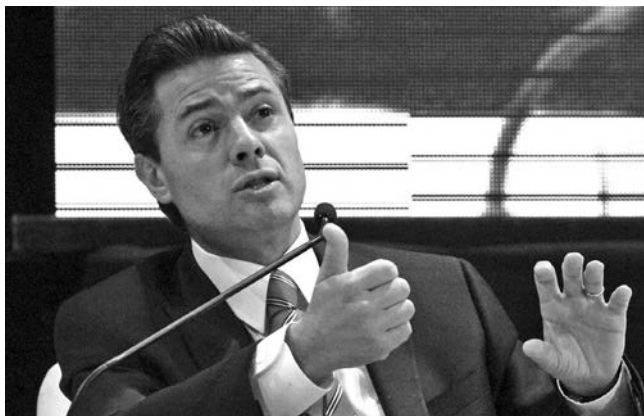
Presidente Enrique Peña Nieto.