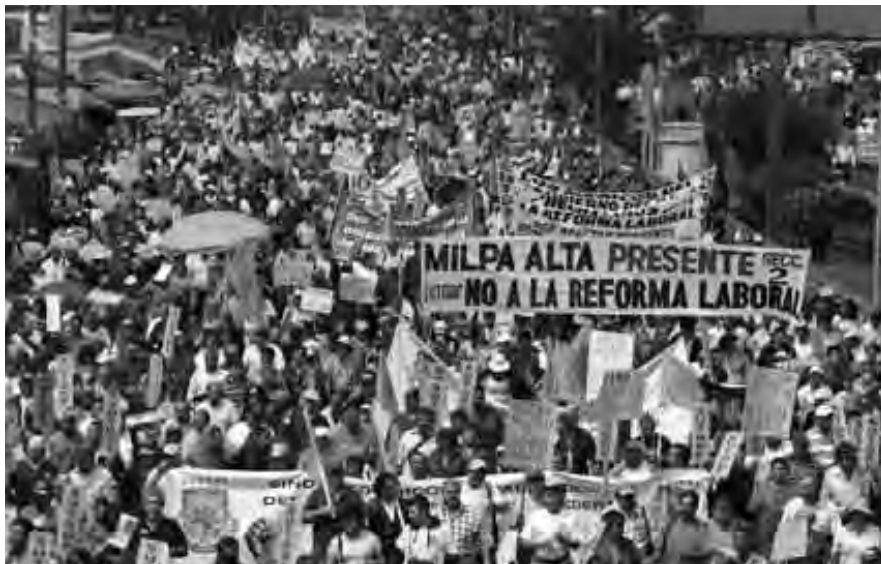
PROTESTAS Y REPUDIO DE TRABAJADORES ANTE OIDOS SORDOS DEL EJECUTIVO Y EL LEGISLATIVO.

La reforma pretendida por Calderón, el PAN y los empresarios promueve y facilita los despidos, dado que abaratará los juicios de despido mismo si llega a convertirse en ley; prevé que sólo se pagará un año de salarios caídos en los litigios laborales, cuando por lo regular estos conflictos tardan más de 3 y hasta 5 años en resolverse, en tanto que los tiempos adicionales de un litigio serían gratuitos para los patrones, con lo cual se agudizaría el castigo para los trabajadores.