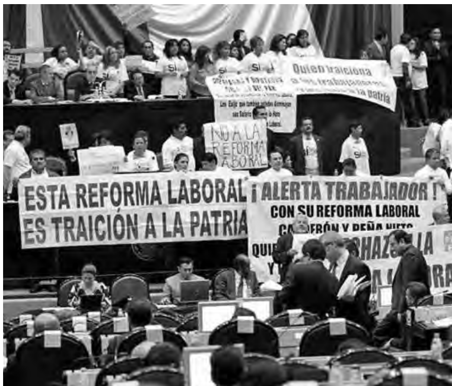
DIPUTADOS DE IZQUIERDA TOMAN LA TRIBUNA EN RECHAZO A LA INICIATIVA DE CALDERÓN.

A punto de irse del poder, Felipe Calderón Hinojosa introduce de última hora un proyecto de reforma laboral que, por sus contenidos, evidentemente fue elaborado por los abogados e integrantes del Consejo Coordinador Empresarial (CCE) y por los de la Confederación Patronal de la República Mexicana (COPARMEX). Este gobierno sólo aparece como un servil aliado de esos grupos de interés. La pretensión es echarle al nuevo gobierno el pesado lastre de un proyecto de mandato “legal” atentatorio a los intereses y derechos fundamentales de los trabajadores de México, que aglutina la política antisindical y antiobrera del actual sexenio y el de su antecesor Vicente Fox Quezada.