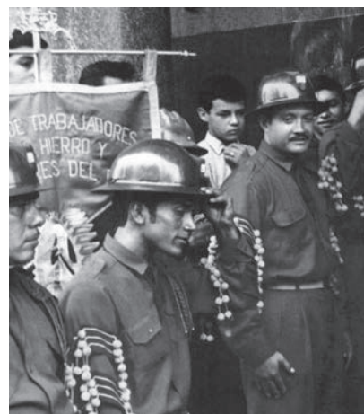
EL PRESIDENTE ADOLFO LÓPEZ MATEOS EN NUESTRA SINDICATO, 19 DE JULIO, DÍA DEL MINERO, EN NUESTRA S

entero. Hoy el Sindicato Minero está más unido y firme que nunca antes en toda su historia. Ni agresiones ni calumnias conseguirán vencerlo en el presente ni en el futuro, como lo reconocen los