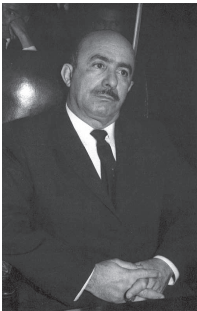
DON NAPOLEÓN GÓMEZ SADA, GRAN LÍDER Y GUÍA DEL SINDICATO MINERO.

SU EXISTENCIA HA SIDO MUY FRUCTÍFERA PARA LOS TRABAJADORES MINEROS, METALÚRGICOS Y SIDERÚRGICOS DE MÉXICO.