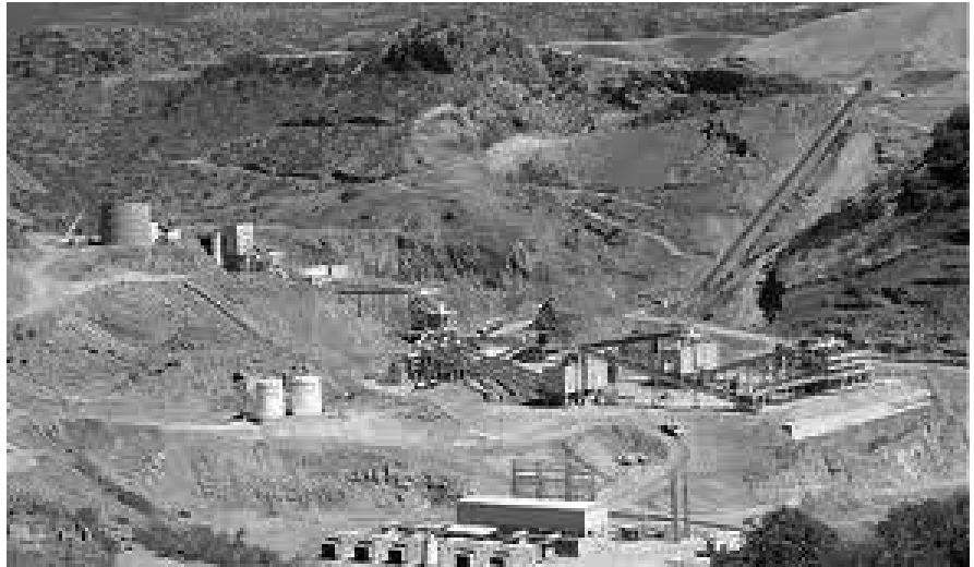
MINA LA PLATOSA, DENTRO DEL EJIDO LA SIERRITA.

La tercera opción fue representada por el inexistente sindicato “Adolfo López Mateos”, que sólo es un membrete creado por Excellon Resources de México, con el propósito