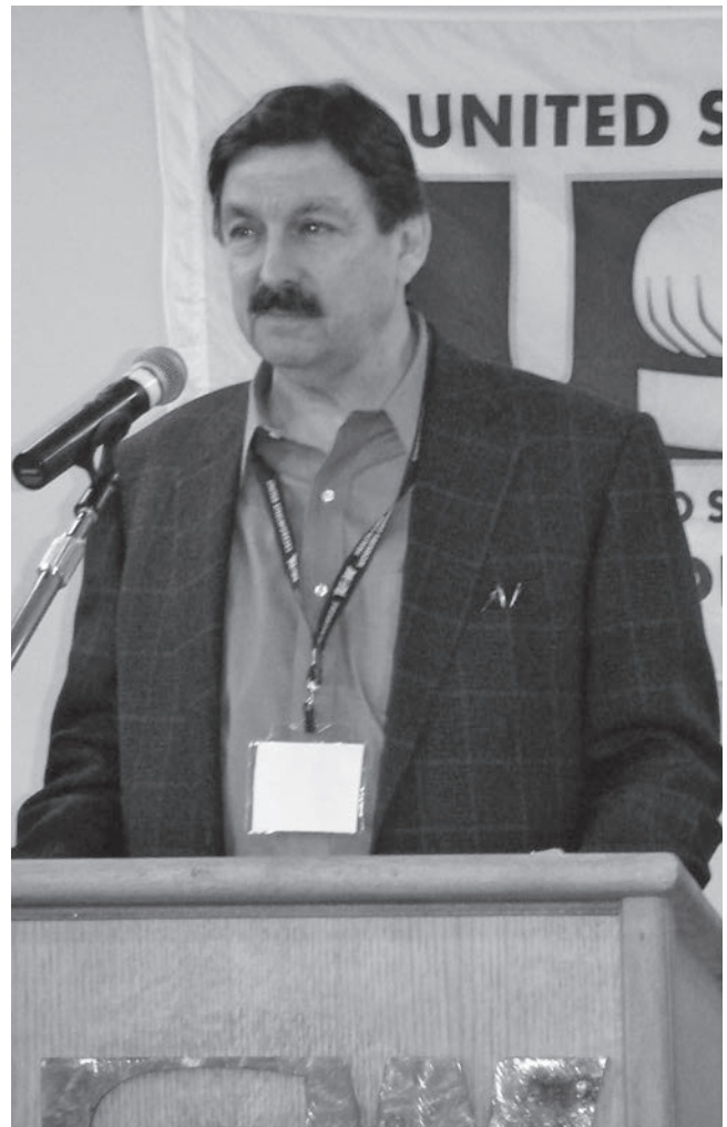
NAPOLEÓN GÓMEZ URRUTIA, REINDIVICACIÓN DE LA LUCHA A FAVOR DE LOS MINEROS Y SUS FAMILAS.