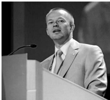
JYRKI RAINA, LÍDER DE INDUSTRIALL GLOBAL UNION.

Te escribo en mi carácter de Secretario General de IndustriALL Global Union, que representa a 50 millones de trabajadores del sector minero,