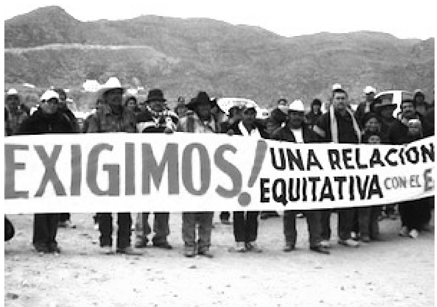
EJIDATARIOS DE BERMEJILLO.

Los ejidatarios, por su parte, denunciaron que sus demandas no han sido escuchadas por los directivos de la empresa, quienes con actitu-