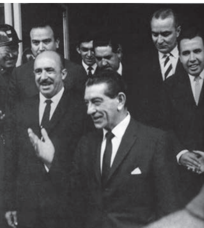
Y NAPOLEÓN GÓMEZ SADA, UN 11 DE AÑO DE SINDICAL.

El secreto de esta permanencia histórica en las luchas sociales del México moderno está sin duda determinado por el hecho de que el Sindicato Minero ha puesto por delante los valores supremos de la clase trabajadora: la unidad, la lealtad, la solidaridad, así como la congruencia entre lo que predica y lo que actúa. No hay fisuras ni grietas en esta sólida contextura política y moral. El de Los Mineros es un gremio que nació en medio de la adversidad y sigue viviendo dentro de ella, sin jamás haber renunciado a la dignidad ni al respeto que ofrece con generosidad a los demás actores sociales de su entorno laboral, social y político, pero que también se los demanda a ellos con firmeza.