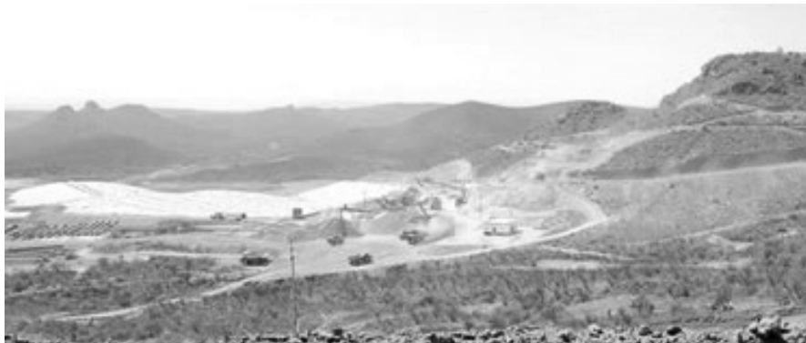
PREDIO EN LITIGIO.

minero-ejidal, por lo cual se le ha calificado de calumniosa. Tal pareciera, según esas versiones, que los ejidatarios y los trabajadores mineros no tuvieran criterio propio y fueran movidos por entidades externas a ellos para demandar justicia.