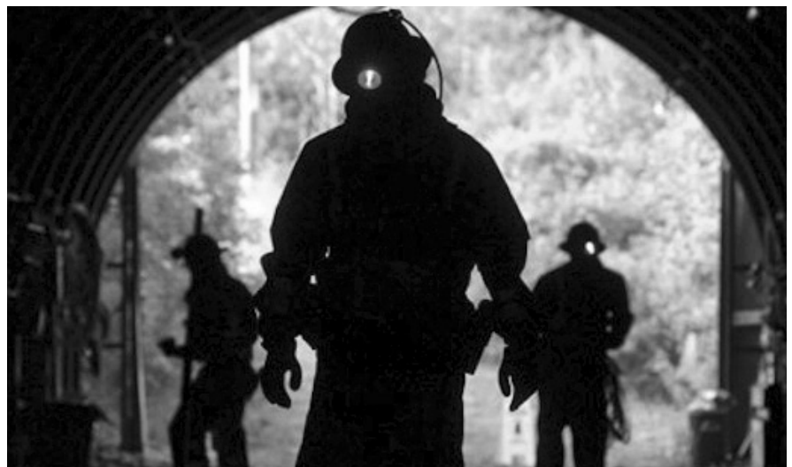
EXCELLON EN CONSTANTE AGRESIÓN CONTRA MINEROS.

► La innovación es lo que distingue a un líder de los demás. Steve Jobs (1955-2011). Empresario e informático estadounidense.