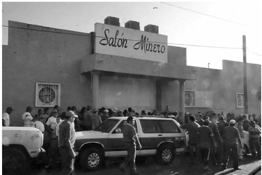
AMAÑADO RECUENTO EN EL QUE AUTORIDADES LABORALES Y EMPRESA BENEFICIARON A SINDICATO CHARRO.

Desde hace meses, tanto la empresa señalada a través de un sindicato blanco, así como el grupo espurio de Carlos Pavón Campos, “la marrana” como le dicen los trabajadores mineros, le disputaban la titularidad de las relaciones contractuales a la Sección 309 del Sindicato Nacional de Mineros que encabeza el compañero Napoleón Gómez Urrutia.