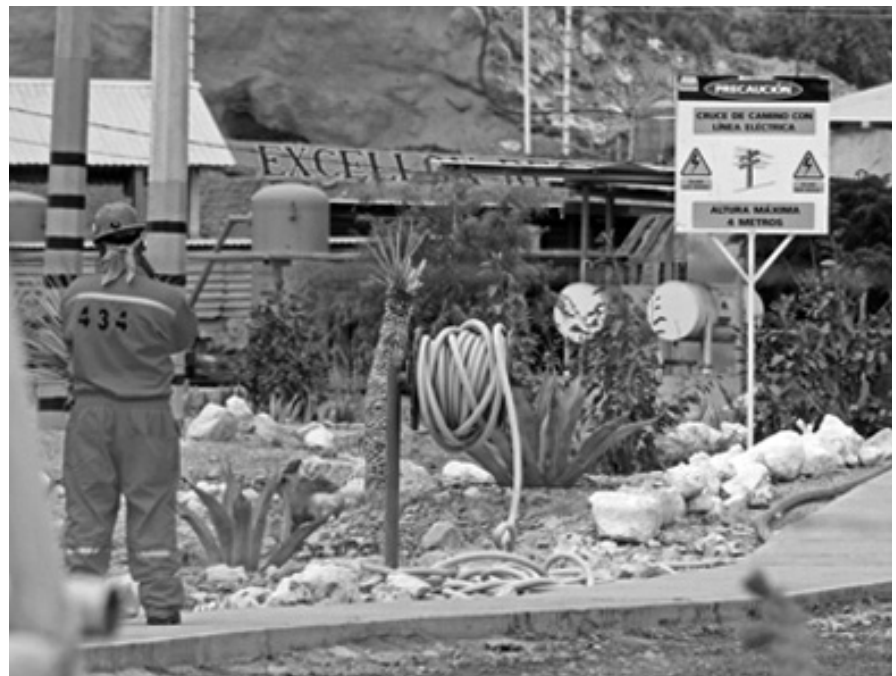
PROTESTA MINERA POR LA VIOLACIÓN A LA LIBERTAD DE ASOCIACIÓN SINDICAL.

El Sindicato Nacional de Mineros, por su parte, declara que no dejará impune esta serie de graves irregularidades en el recuento de la Sección 309 de Bermejillo, Durango, y acudirá a todas las instancias, tanto para denunciar estos hechos como para exigir un nuevo recuento secreto, libre y con garantías de seguridad. 🗣️