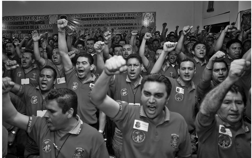
UNIDAD, AVANCE Y COMBATIVIDAD, LAS SIGNOS DE LA 37 CONVENCION NACIONAL MINERA.

Asimismo, se realiza contando con la incondicional solidaridad creciente de organizaciones sindicales tanto de México como del mundo entero, en especial la Federación Internacional de Trabajadores de las