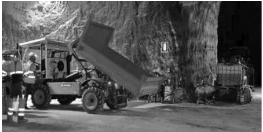
LA TRASNACIONAL EXCELLON PRETENDE PISOTEAR DERECHOS DE LOS TRABAJADORES MINEROS Y DE LOS PROPIETARIOS DE LAS TIERRAS QUE EXPLOTA EN MÉXICO.