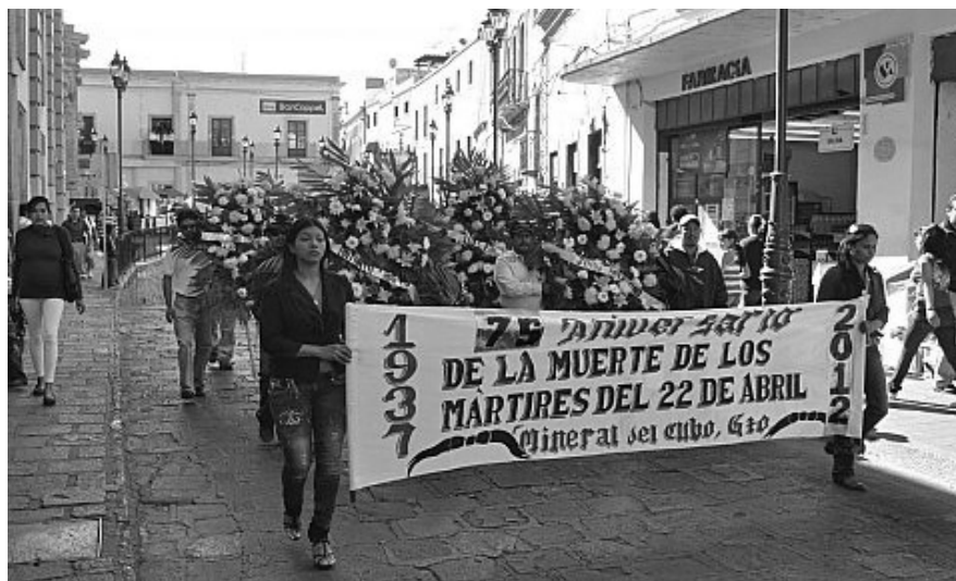
LOS MÁRTIRES DE GUANAJUATO ESCRIBIERON CON SU SANGRE UNA DE LAS PÁGINAS MÁS IMPORTANTES DE LA HISTORIA MINERA.