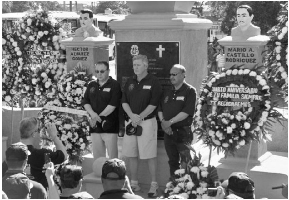
LOS STEELWORKERS, COMO CADA AÑO, RINDIERON HOMENAJE A LOS MÁRTIRES DE LÁZARO CÁRDENAS, JUNTO A SUS HERMANOS MINEROS DE MÉXICO.