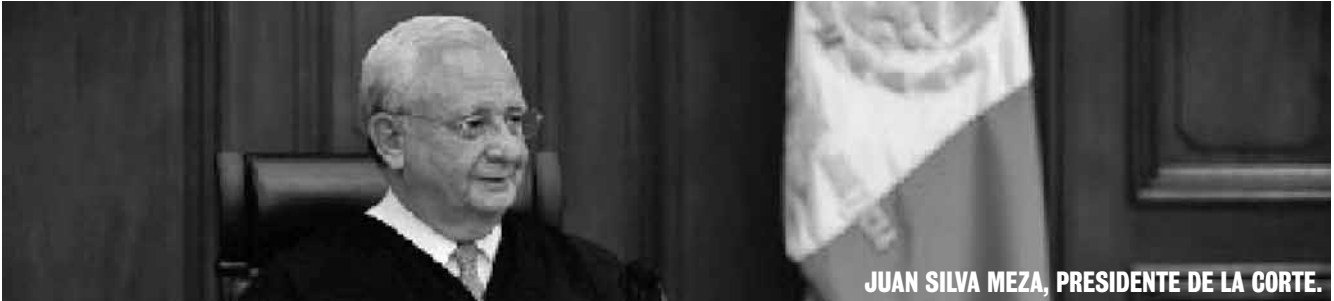
JUAN SILVA MEZA, PRESIDENTE DE LA CORTE.