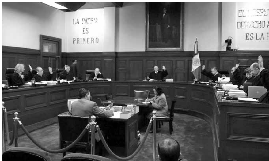
PLENO DE LA SUPREMA CORTE DE JUSTICIA DE LA NACIÓN.

Por 7 votos contra 2, como se dio a conocer en los medios el viernes 18 de noviembre, la mayoría de los Ministros del más alto Tribunal de Justicia de México, consideró que la toma de nota prevista en la legislación laboral, no significa que la autoridad administrativa, en este caso la Secretaría del Trabajo y Previsión Social, desautorice