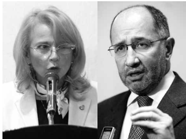
MINISTROS OLGA SÁNCHEZ CORDERO Y JOSÉ RAMÓN COSÍO.

Con la aprobación ya desechada del proyecto elaborado anteriormente se hubiera violado la mencionada jurisprudencia 14/2009 que consagra la autonomía y libertad sindicales, aprobada en meses recientes. Queda el Sindicato Nacional de Mineros en espera del nuevo proyecto que se elabore, que no puede ir en sentido contrario a esta última resolución positiva de los Ministros de la SCJN. 🗣️