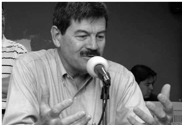
FRANCISCO BARRIO TERRAZAS.

NGU: Bueno yo espero que sí, que esta obsesiva y demencial persecución política se termine o por lo menos que cambie de rumbo. Sería el colmo que continuaran con esta absurda, repugnante persecución, porque no tiene sentido, porque no tiene fundamento, lo hemos demostrado una y mil veces. Inventaron acusaciones falsas para des-