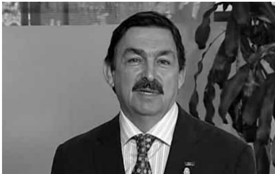
NAPOLEÓN GÓMEZ URRUTIA.