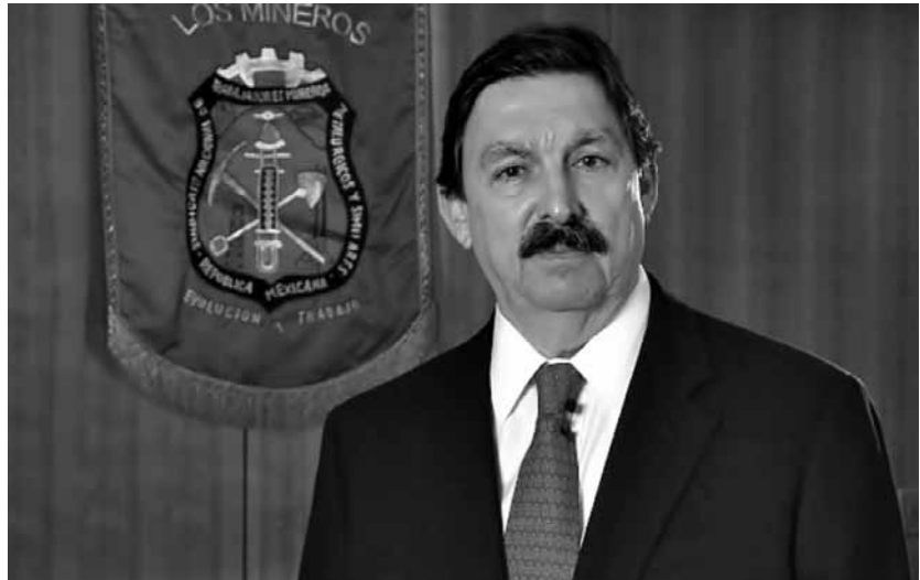
NAPOLEÓN GÓMEZ URRUTIA, LIDER DEL SINDICATO NACIONAL DE MINEROS.