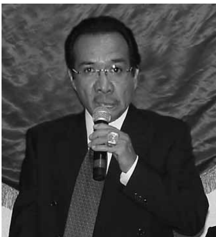
ADEMÁS DE LADRÓN, CÍNICO Y EXHIBE EL PRODUCTO DE SUS HURTOS.

Este sujeto abusó de los bienes sociales que el Sindicato le había dado en custodia, y ocultamente cobró jugosas rentas durante muchos años por el alquiler a terceros de edificios o predios en diferentes poblaciones del estado de Hidalgo, o sea, utilizó en su beneficio personal recursos que debió entregar al Sindicato, hasta juntar una fortuna de muchos millones de pesos.