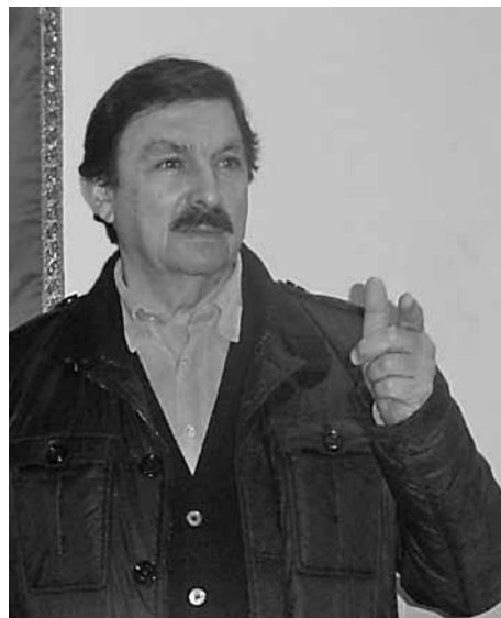
NAPOLEÓN GÓMEZ URRUTIA

Estimados compañeros dirigentes de la Federación Internacional de Trabajadores de las Industrias Metalúrgicas, FITIM: