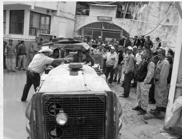
ESBIRROS DE LA EMPRESA AMENAZAN A MINEROS GUANAJUATENSES.

Discúlpenos por la forma en que se los damos a conocer, debido a que nosotros no contamos con dinero, que nos pidieron en el canal 8, para hacer públicas nuestras inconformidades”.