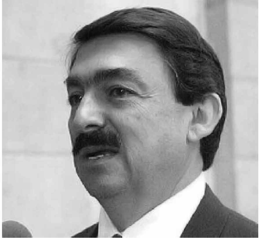
NAPOLEÓN GÓMEZ URRUTIA.

Refirió que en México el rescate hubiera sido más fácil que el de la mina de San José, en Chile, debido a que esta se ubica en una zona de montañas, en roca más dura, en un terreno más complicado y a 700 metros de profundidad, en tanto que en Pasta de Conchos los trabajadores estaban a tan sólo 120 metros de profundidad, en un terreno más sua-