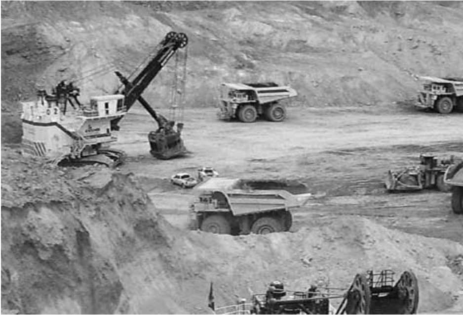
MINA EL PEÑASQUITO, EN ZACATECAS.

Este avance, indicó, se alcanzó en un marco de positivo entendimiento, buena voluntad y respeto recíproco entre las partes, y con una visión de futuro y responsabilidad social compartida, para beneficio de los trabajadores y sus familias, así como de la empresa, de la industria minera nacional y de todo México.