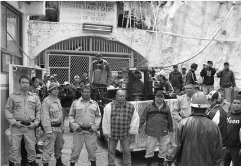
MINEROS DE EL CUBO ROMPEN “MANEJO INFORMATIVO” MEDIANTE VOLANTES.

teadas por la autoridad, la empresa obliga a los trabajadores a laborar más horas de trabajo sin el pago correspondiente, y menos cumple con las prestaciones de ley como es el legítimo reparto de utilidades conforme a la ley.