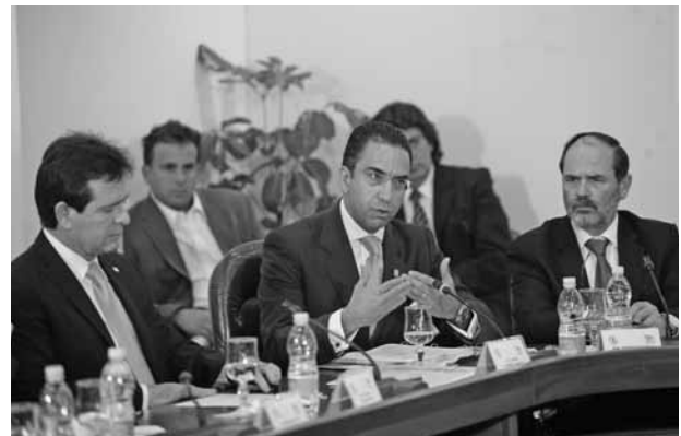
A LOZANO NO LE IMPORTÓ RECOMENDACIÓN DEL SENADO.

► Un síntoma de que te acercas a una crisis nerviosa es creer que tu trabajo es tremendamente importante. Bertrand Russell (1872-1970). Filósofo, matemático y escritor inglés.