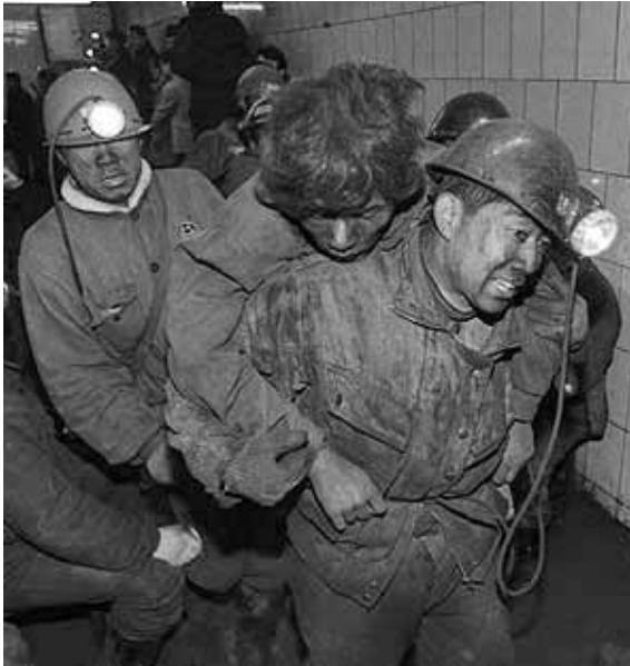
RESCATE DE UN MINERO CHILENO. EN LA MINA DE LA REGIÓN DE ATACAMA, A 688 METROS DE PROFUNDIDAD FUERON ENCONTRADOS CON VIDA 33 DE SUS COMPAÑEROS A QUIENES SE TRATA DE SALVAR A TODA COSTA.

Golborne, acudieron a las proximidades del yacimiento, a 880 kilómetros de la capital Santiago, para coordinar tareas de rescate, luego de producirse el anunció de 33 mineros sobrevivientes.