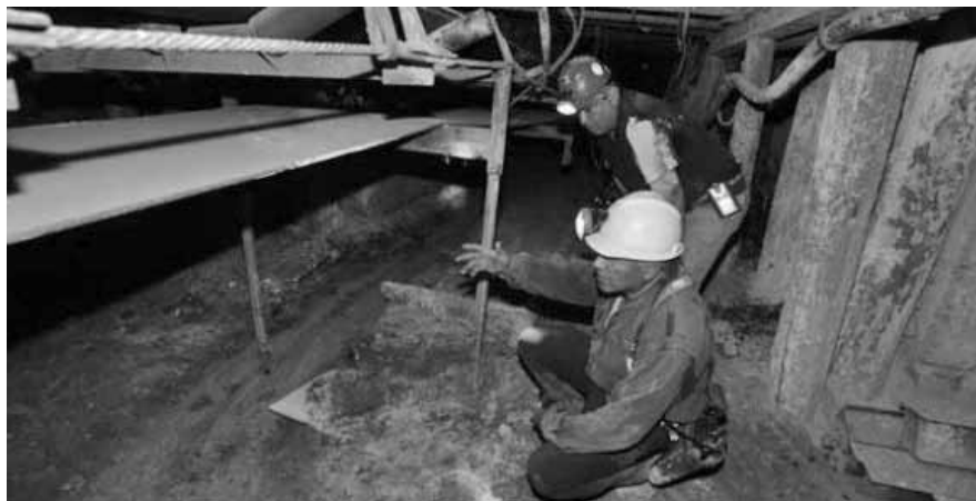
VIUDAS, RESCATISTAS MEXICANOS Y EXTRANJEROS LLEGARON MUY CERCA DE DONDE ESTAN SEPULTADOS LOS MINEROS FALLECIDOS EL 19 DE FEBRERO DE 2006 EN PASTA DE CONCHOS. EMPRESA Y GOBIERNOS FEDERAL Y ESTATAL, FRENARON LOS TRABAJOS.

Esto último ocurrió en China, provincia de Shanxi, donde el 6 de abril pasado sorpresivamente se encontraron con vida 114 mineros del carbón que sobrevivieron 8 días y 8 noches bajo tierra, de un total de 153 hombres que quedaron atrapados por la inundación en una mina. Allí, autoridades y equipos de salvamento de la empresa no cejaron en su empeño por salvar a los trabajadores, hasta que se obtuvo este resultado, continuando en la búsqueda de los 39 restantes.