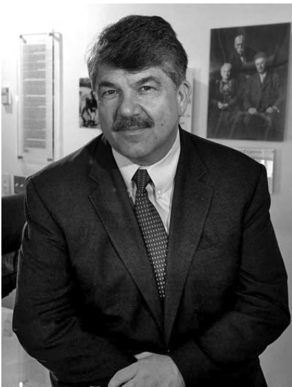
RICHARD L. TRUMKA.