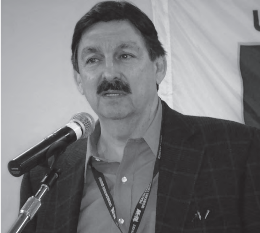
NAPOLEÓN GÓMEZ URRUTIA.

libertad y autonomía sindicales, en nuestra defensa de los derechos obreros fundamentales como el derecho a la huelga, a la contratación colectiva y a un constante mejoramiento económico y social de nuestros compañeros agremiados y sus familias. “¡No nos han doblegado ni nos doblegarán! ¡Esta es nuestra decisión irrevocable, hasta la victoria definitiva!