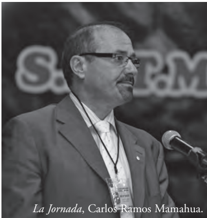
La Jornada, Carlos Ramos Mamahua.