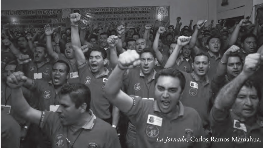
La Jornada, Carlos Ramos Mamahua.