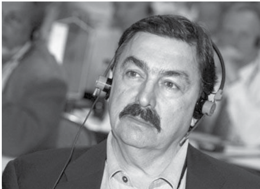
NAPOLEÓN GÓMEZ URUTIA

Añadió que algunos en México no quieren un país de trabajadores dignos. “Este gobierno tiene la vista puesta en el pasado, en el régimen de Porfirio Díaz; pretenden un im-