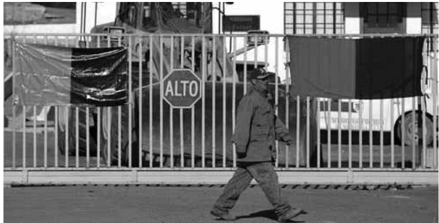
USAR LA FUERZA PÚBLICA VIOLARÍA UN AMPARO VIGENTE.