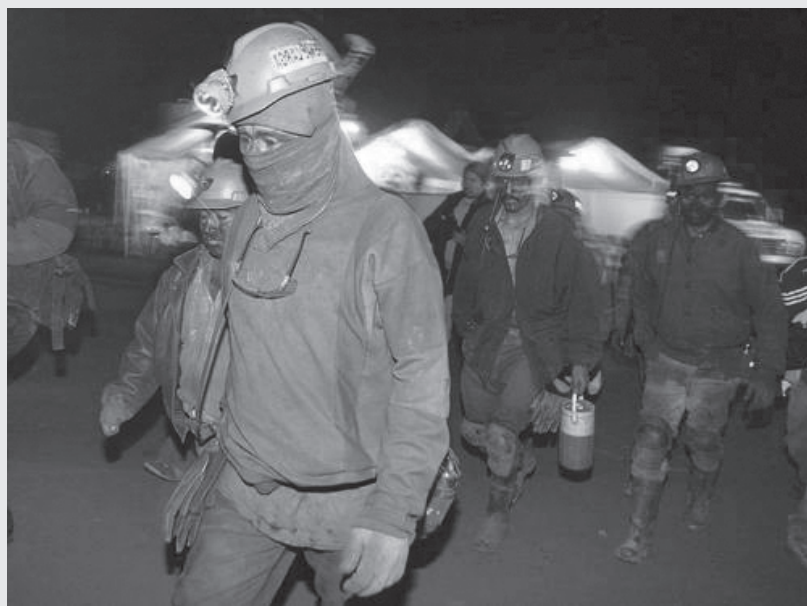
EL INTENTO DE RESCATE EN PASTA DE CONCHOS, IMPEDIDO POR EL GOBIERNO.

Demanda medidas cautelares que impidan la ocupación por la fuerza de la mina.