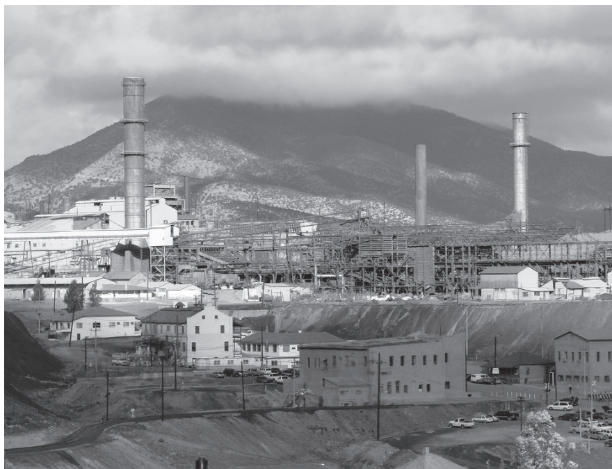
LOS TRABAJADORES DEMOSTRARON QUE SE PUEDE REACTIVAR LA MINA.

*Reportaje publicado el 7 de febrero en la revista Proceso.