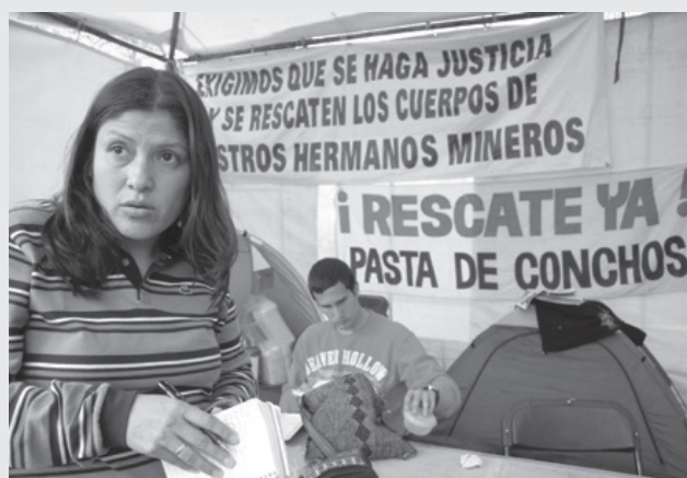
LAS VIUDAS EXIGEN JUSTICIA.

*Columna publicada el 19 de febrero de 2010 en el periódico La Jornada.