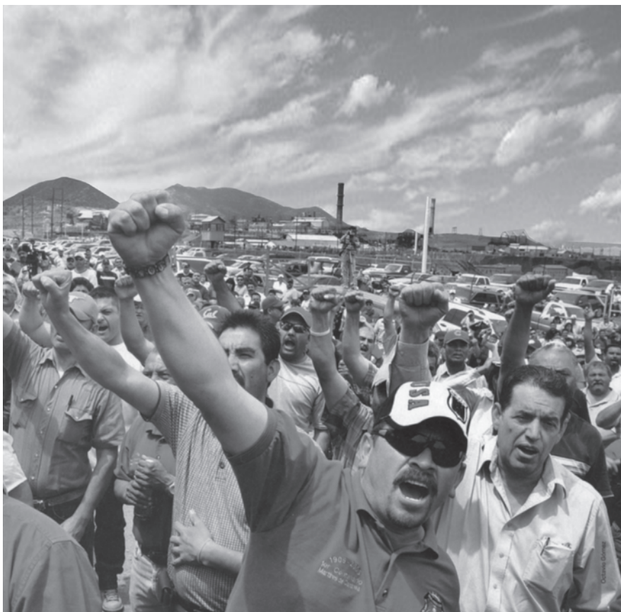
MINEROS EN LUCHA POR EL RESPETO A SU CONTRATO COLECTIVO Y A SU HUELGA.

En lo alto de un cerro se ubica el puesto de mando. Desde ahí se dominan los enormes tajos de la mina y toda la operación extractiva.