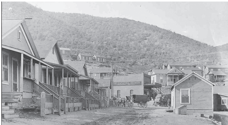
CANANEA, POBLACIÓN DESOLADA POR CULPA DE LARREA.

como 5 mil empleos indirectos más, una mejora en el entorno urbano, y programas de salud y educación para la ciudad.