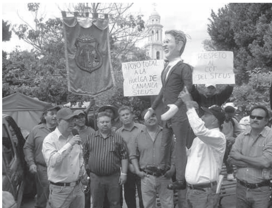
TRABAJADORES UNIVERSITARIOS SONORENSES SE SOLIDARIZAN CON LOS MINEROS EN HUELGA.

Los controles, palancas y equipos de radiocomunicación lucen intactos. Cables de 20 centímetros de grosor, tendidos por varios kilómetros en el piso, son de cobre y nadie los ha robado. La palas, gigantes molles de acero, exhiben instalaciones impecables.