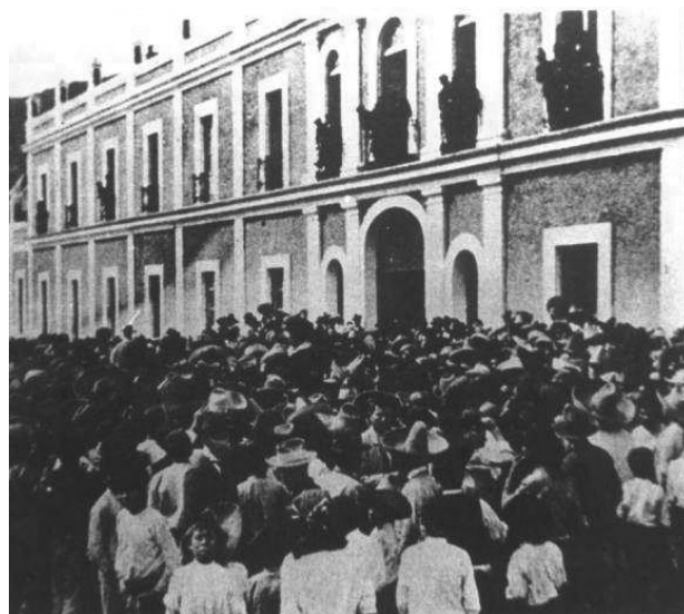
HUELGA MARTIR DE RIO BLANCO EN 1907.

► El conocimiento nos hace responsables.