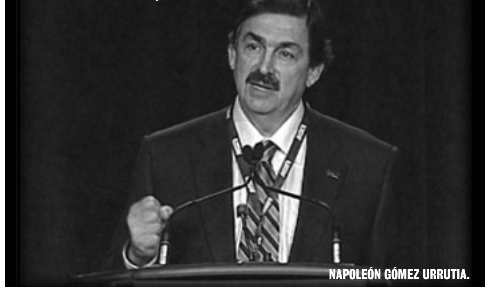
NAPOLEÓN GÓMEZ URRUTIA.