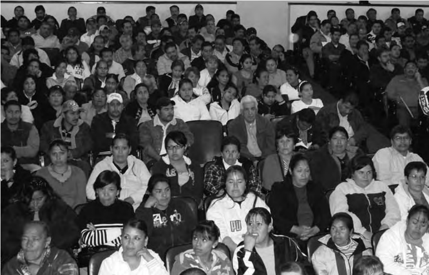
INTEGRANTES DEL FRENTE NACIONAL DE MUJERES EN LUCHA POR LA DIGNIDAD DE LOS TRABAJADORES EN MÉXICO.

traidor Carlos Pavón, quien encabezó y azuzó la agresión de ese día contra trabajadores inermes.