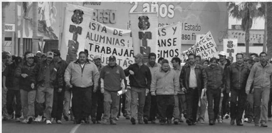
EL GOBIERNO DE CALDERÓN, IDENTIFICADO COMO UNO DE LOS REGÍMENES MÁS REPRESIVOS EN MATERIA LABORAL.

*Artículo publicado en el diario La Jornada el sábado 30 de enero de 2010.