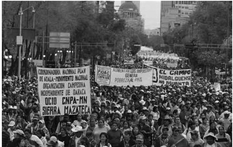
MULTITUDINARIO APOYO DE TRABAJADORES A MINEROS Y ELECTRICISTAS EL 29 DE ENERO.