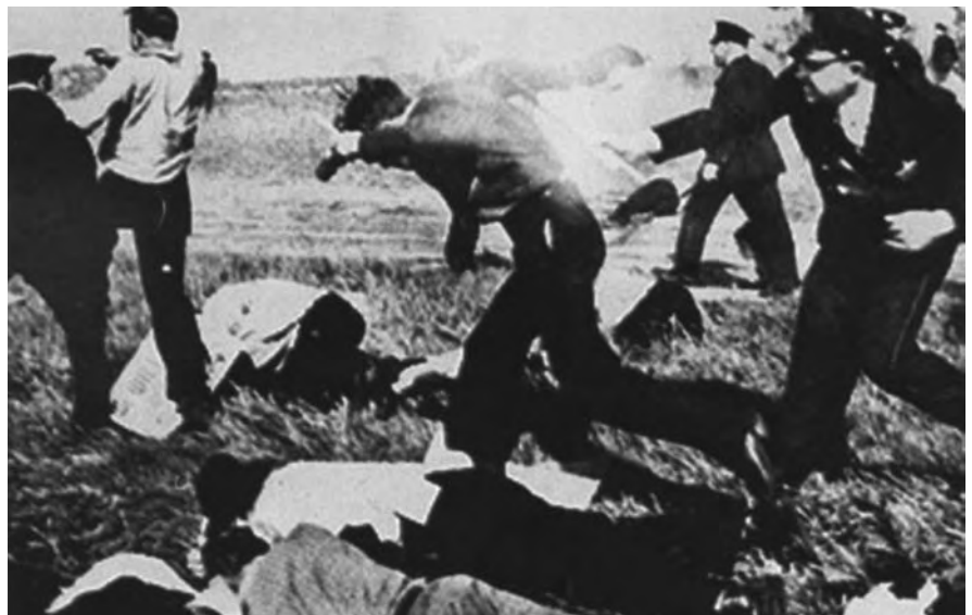
SIN ADVERTENCIA LA POLICÍA TIROTEÓ A OBREROS DESARMADOS.

Actualmente, en cada Día del Recuerdo, los trabajadores del acero de Chicago conmemoran tanto en su sede sindical, así como en la calle donde ocurrió la masacre, el sacrificio de estas valientes personas que construyeron su Sindicato. 🌐