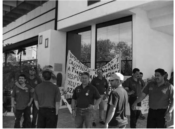
PROTESTAN MINEROS FRENTE A OFICINAS DE GRUPO MÉXICO, EN UNO DE LOS EPISODIOS DE LA LUCHA.

NGU precisó tajante que “si se comete esa traición al Derecho Constitucional y al Derecho Universal de Huelga, resistiremos con todo lo que esté a nuestro alcance y la denunciaremos en todo el mundo, porque afortunadamente tenemos una gran relación con la mayoría de los sindicatos y federaciones internacionales de trabajadores, donde más de 200 millones de sus afiliados