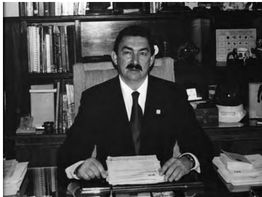
Napoleón Gómez Urrutia Secretario General