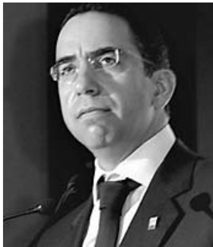
FERNANDO GÓMEZ MONT Y JAVIER LOZANO ALARCÓN, SON LOS ARIETES DE LA POLÍTICA DEL GOBIERNO DICTADA POR GRUPO MÉXICO, EN CONTRA DEL SINDICATO MINERO Y SU DIRIGENCIA NACIONAL.