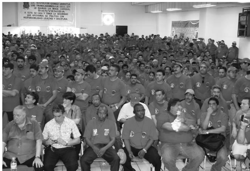
LA EXIGENCIA CONSTANTE AL GOBIERNO DE CALDERÓN, FUE EL CESE DE LA PERSECUCIÓN POLÍTICA EN CONTRA DE NUESTRO LIDER, NAPOLEÓN GÓMEZ URRUTIA.

les de trabajadores que acudieron desde sus países a manifestar su solidaridad activa con los mineros