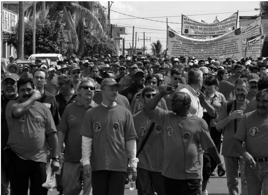
HOMBRO CON HOMBRO, MÁS DE 10 MIL COMPAÑEROS MINEROS DE MÉXICO Y OTROS PAÍSES, MARCHARON POR LAS CALLES DEL PUERTO DE LÁZARO CARDENAS, MICHOACÁN, PARA CONMEMORAR EL 75 ANIVERSARIO DEL SINDICATO NACIONAL MINERO.

política laboral que respeten los derechos fundamentales de los trabajadores, así como su autonomía y libertad sindical. Una nueva política patronal que enseñe a los empresarios a trabajar con justicia y asumir su responsabilidad social.