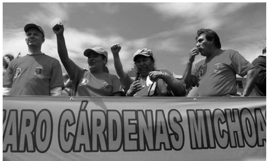
EN LOS FESTEJOS DEL 75 ANIVERSARIO DE LA FUNDACIÓN DEL SINDICATO MINERO, EL ÍMPETU Y LA FUERZA FEMENIL TAMBIÉN ESTUVIERON PRESENTES.

El numeroso contingente nacional e internacional minero en todo momento se vio arropado por la calidez de los habitantes del Puerto de Lázaro Cárdenas. 🍷