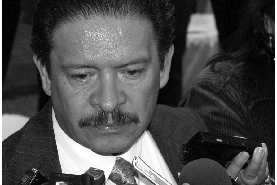
LA VOZ DEL SENADOR PERREDISTA, CARLOS NAVARRETE, AL MEJOR POSTOR. COBRA QUINCENA EN LA NÓMINA DE GRUPO MÉXICO.