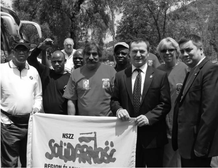
LA SOLIDARIDAD DE LOS MINEROS DEL MUNDO SE PUSO DE MANIFIESTO EN APOYO A LA LUCHA QUE SOSTIENEN SUS HERMANOS MEXICANOS.

gobierno para que se respeten los derechos de los trabajadores, pues “¿qué ha hecho este gobierno por la clase trabajadora que no sea perseguirla y agredirla?”. Es necesario un cambio nacional para que se respeten los derechos de los trabajadores y se acaben las perversas y corruptas conductas patronales que tanto daño han hecho a los trabajadores y sus familias, dijo.