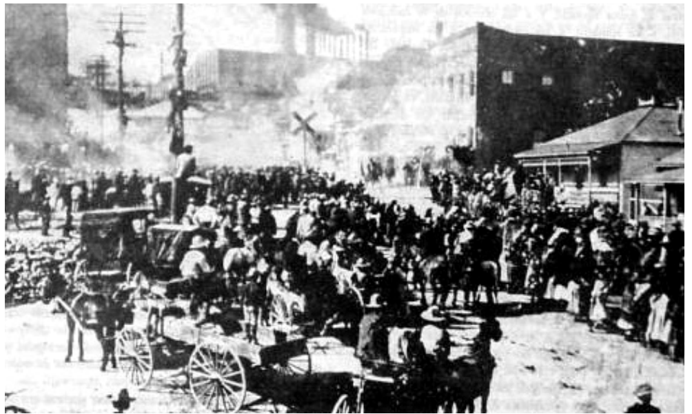
MANIFESTACIÓN DE OBREROS MINEROS EN CANANEA, 1906.

AYER FUE GREENE, AHORA GERMÁN LARREA • AQUÍ DETONÓ LA LUCHA REVOLUCIONARIA • FOCO ROJO DE UN NUEVO ESTALLIDO SOCIAL