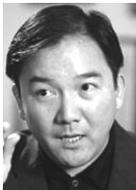
ZHENLI YE GON.