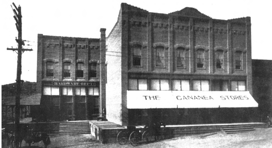
TIENDA DE RAYA EN CANANEA.

Una intentona más de pisotear los derechos de huelga de los trabajadores mineros, fue el pedimento de revisión del 13 de febrero, de Grupo México, con el que pretendió romper la huelga legal estallada en Cananea.