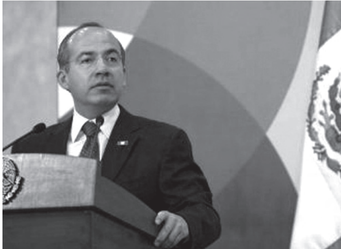
FELIPE CALDERÓN HINOJOSA RECIBIÓ LA CARTA DEL SINDICATO MINERO.