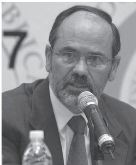
GUSTAVO MADERO MUÑOZ .

Y eso mismo demandamos de su Gobierno y de sus funcionarios, que no practiquen el influyentismo y que se pongan en los zapatos de los trabajadores, especialmente de los que están en huelga hace más de diez meses, y aquilaten el sacrificio que implica realizar una huelga por defender sus derechos pisoteados y por defender la autonomía sindical de los trabajadores mineros, metalúrgicos y siderúrgicos de todo el país.