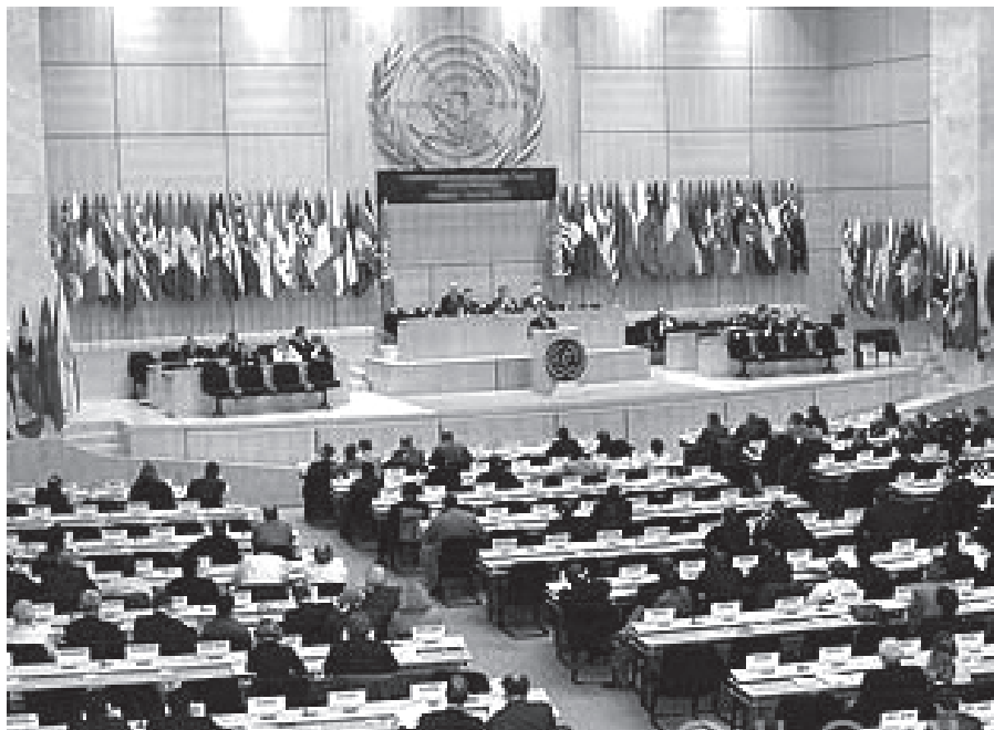
ASPECTO GENERAL DE LA CONFERENCIA INTERNACIONAL DEL TRABAJO.

► Vale más un minuto de pie que una vida de rodillas. José Martí.