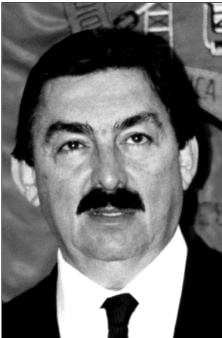
NAPOLEÓN GÓMEZ URRUTIA.

toda vez que al tiempo de reconocer la legalidad de la huelga en Cananea, daba la posibilidad a sindicalizados de regresar a trabajar, lo cual constituye una clara violación al derecho de huelga, en un intento más de romper este básico precepto constitucional.