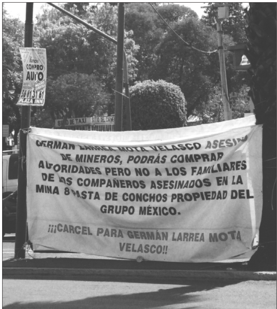
EN LAS PRINCIPALES AVENIDAS, PLAZAS Y PARQUES DEL D.F., FUERON COLOCADAS DEGENAS DE MANTAS Y PANGARTAS CON LEYENDAS EN CONTRA DE LOS ASESINOS DE MINEROS.

Exigimos que se respete el derecho de la clase trabajadora a manifestar sus ideas y que se termine con la impunidad y los privilegios de Germán Larrea y su grupo.