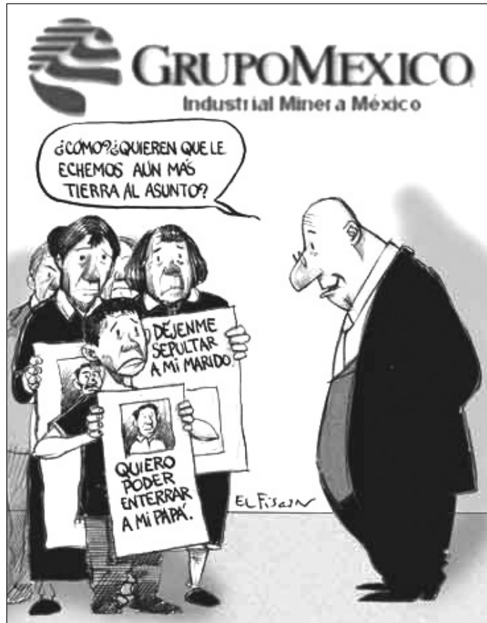
EL FISGÓN. A DOS AÑOS DE PASTA DE CONCHOS.

Grupo México, dijo nuestro líder nacional, pretende o pretendió ignorar el marco legal, como es su costumbre, porque nadie le ha puesto límites ni exigido que