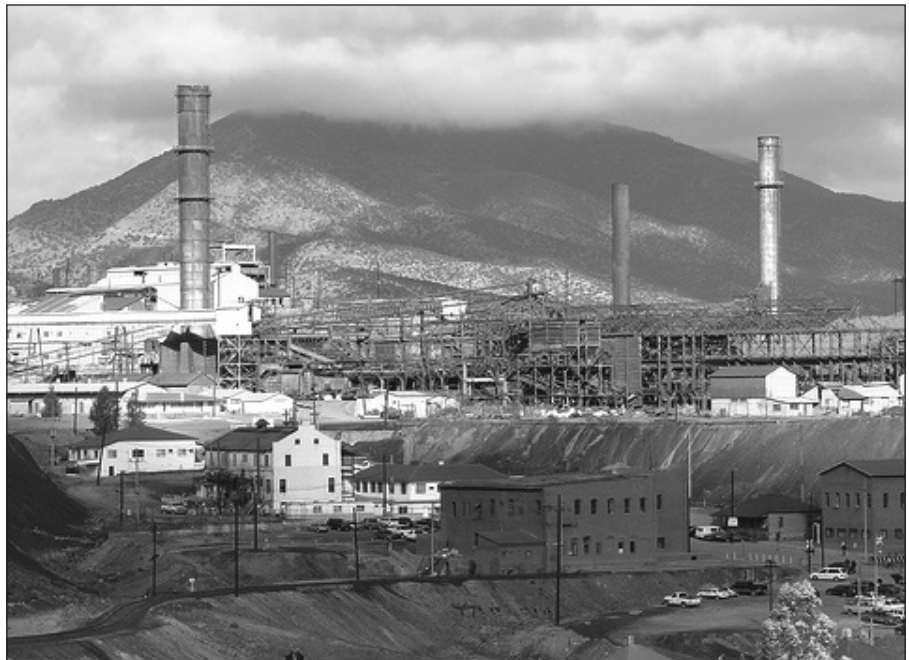
PANORÁMICA DE INSTALACIONES DE LA MINA DE COBRE DE CANANEA.