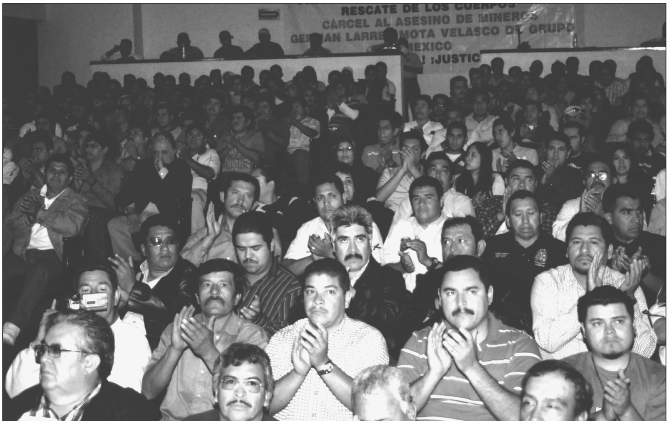
TRABAJADORES MINEROS EN DEFENSA DE SU CONTRATO COLECTIVO DE TRABAJO.

ni el desánimo pese a lo prolongado del conflicto. El Secretario General del Sindicato Nacional de Mineros, Napoleón Gómez Urrutia, declaró para finalizar: “Envío mi más firme mensaje de aliento, apoyo y solidaridad no sólo a mis compañeros trabajadores de la Sección 65 de Cananea, Sonora, sino también de la Sección 17 de Taxco, Guerrero, y de la Sección 201 de Sombrerete, Zacatecas, que llevan ya ocho meses y medio en huelga, y todos esos centros de trabajo pertenecen a Grupo México de Germán Larrea Mota Velasco”.