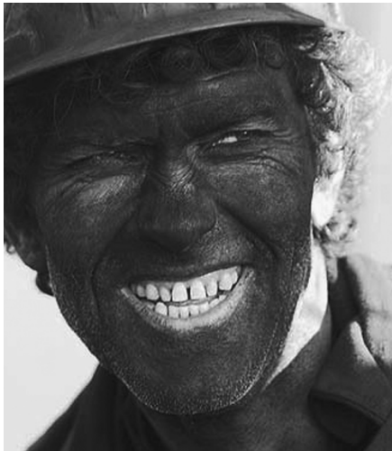
Gasi nueve meses en huelga legal.