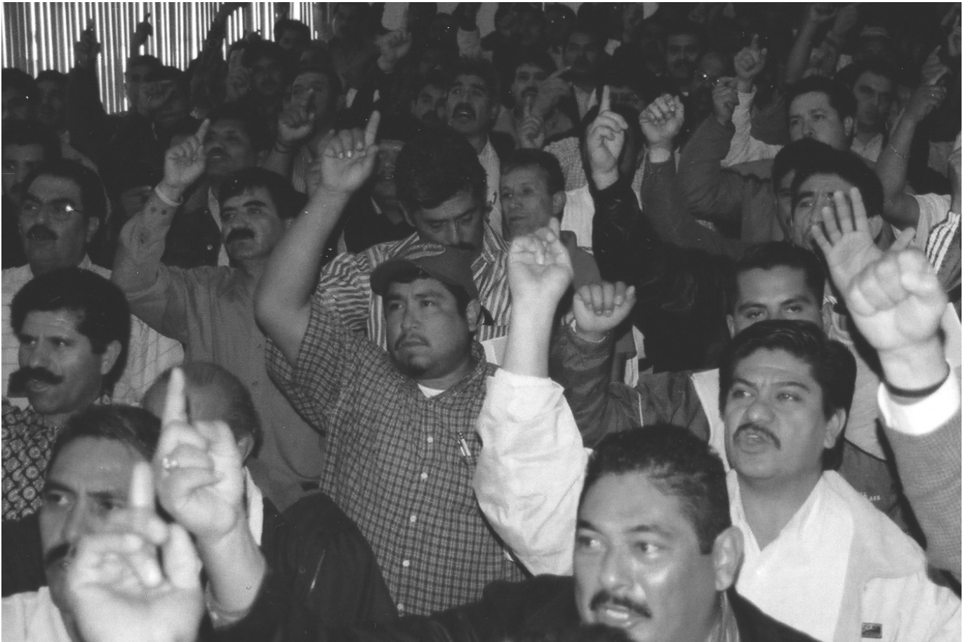
Los mineros condenaron las agresiones al Sindicato y censuraron las campañas de desprestigio de Grupo México.

De todas las asambleas realizadas en días pasados por varias regiones del país, los medios de comunicación estatal y municipal dieron cuenta puntual de lo que aconteció en ellas. Incluso, reseñaron mensajes de apoyo y adhesión de otras organizaciones gremiales, para el Sindicato Minero.