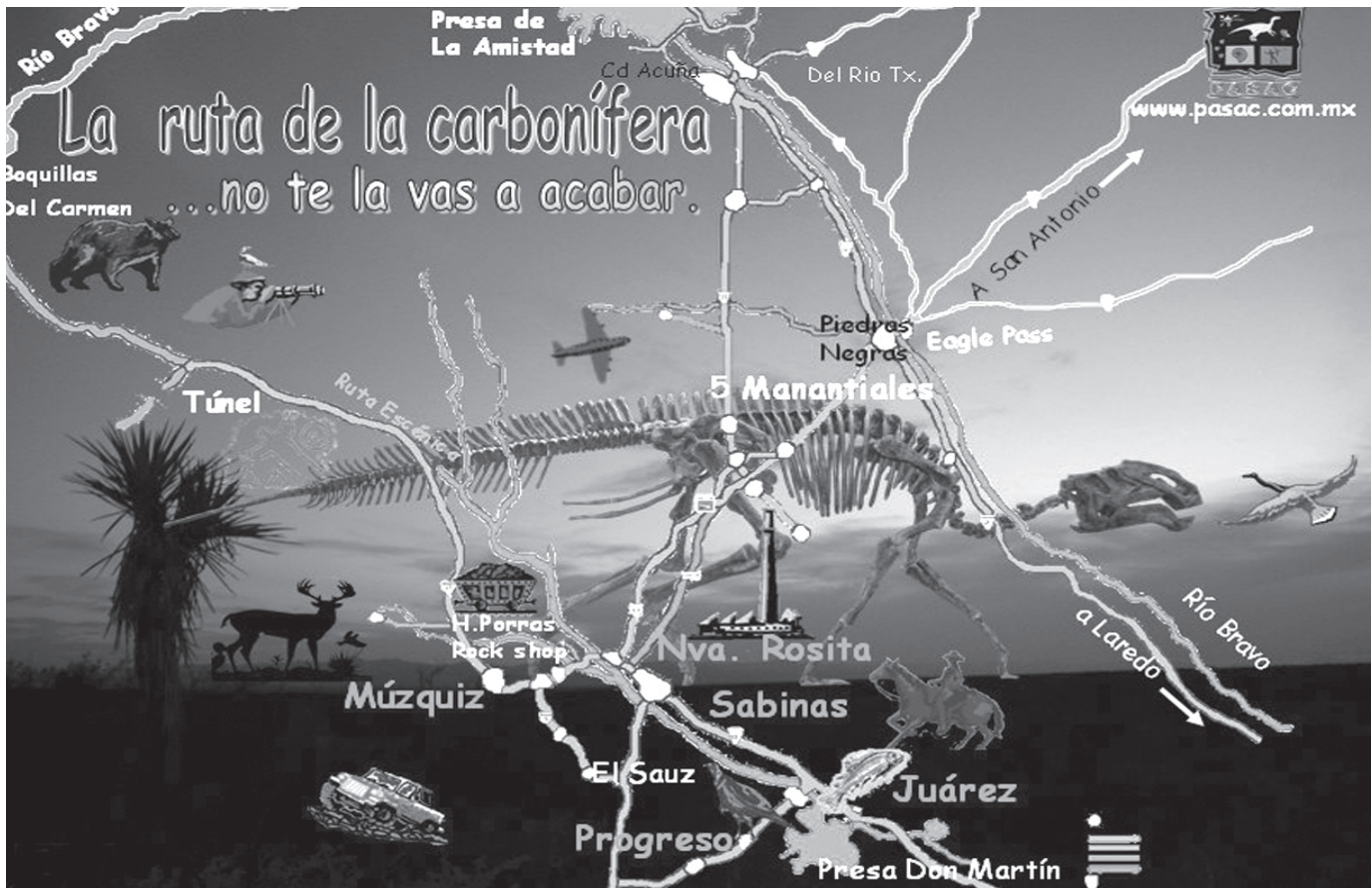
Las estadísticas señalan que entre 1884 y 2007 cada tres días ha muerto un minero.