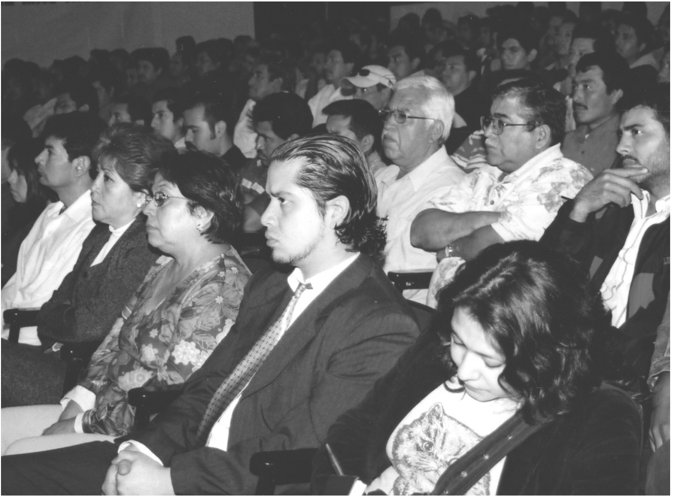
La razón y la legalidad, pilar en que se basa nuestro quehacer sindical.

Someteremos al juicio de la sociedad y de la historia a todos aquellos funcionarios que en actitud servil hacen a un lado su responsabilidad.