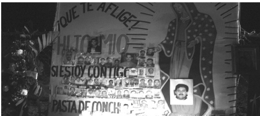
Más de 900 vidas ha cobrado la explotación del mineral en la Cuenca de Coahuila.

Dice que es silencioso, imperceptible, que emana de las negras fauces de los yacimientos de carbón, y ha sido, durante más de cien años, el origen de las tragedias de quienes extraen el mineral y otros metales.