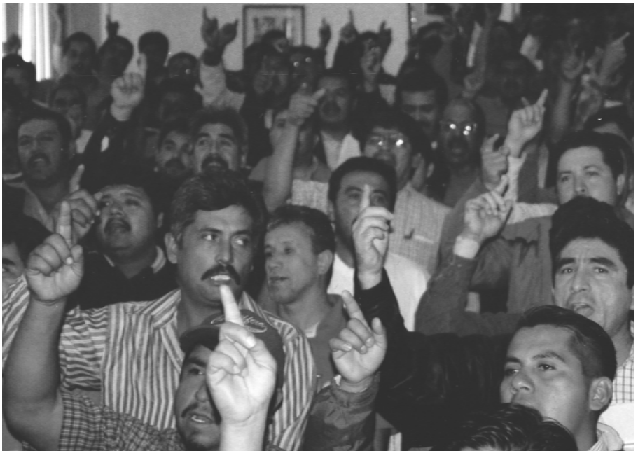
Aspecto de una de las asambleas registradas en apoyo a nuestro dirigente nacional.

APOYO TOTAL A LA GESTIÓN DE NAPOLEÓN GÓMEZ URRUTIA • NI UN PASO ATRÁS EN DEFENSA DE LA AUTONOMÍA SINDICAL • MEJORES SALARIOS Y MÁS PRESTACIONES, LOGROS OBTENIDOS