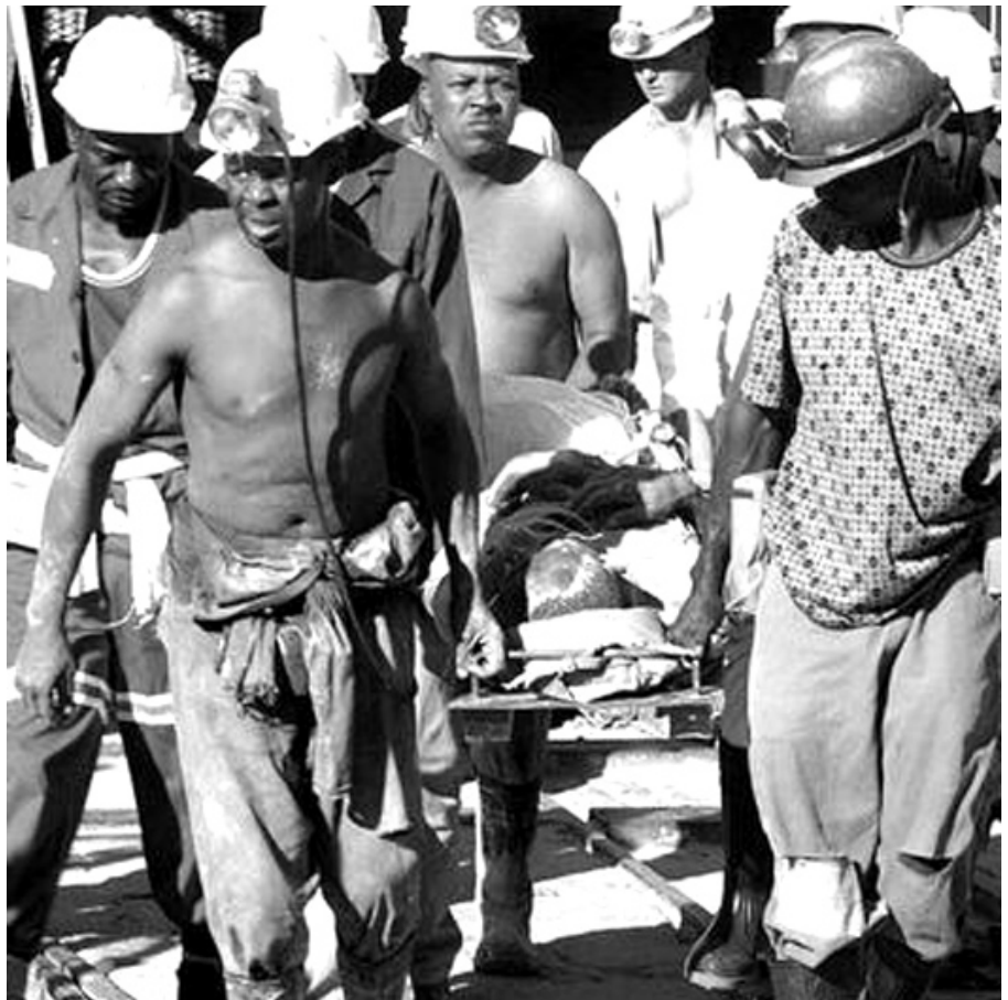
Hace 39 años ocurrió una gran tragedia que enlutó 153 hogares.

En 1969, Barroterán, y en 2006 Pasta de Conchos. Estos son los dos más graves accidentes, pero no los únicos en las minas de la cuenca de Coahuila. Desde que comenzó la explotación del mineral, en la zona las fortunas amasadas con el esfuerzo de los mineros, han cobrado más de 900 vidas durante cien años.