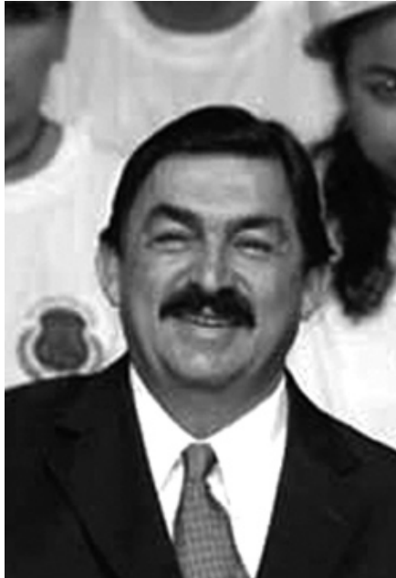
Napoleón Gómez Urrutia.

La orden de reposición del juicio de garantías denota el retraso intencional, puesto que los mismos magistrados, en el caso