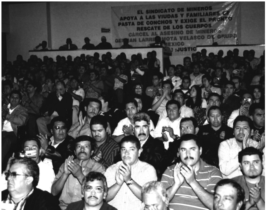
Organizaciones sindicales se unieron al homenaje luctuoso.

Ni Germán Larrea, cabeza del enriquecido Grupo México, ni Vicente Fox se presentaron en Pasta de Conchos para externar su pésame al momento de este terrible holocausto, ni siquiera para conocer la mina y menos para exigir se desarrollasen las tareas de rescate de los cuerpos de los fallecidos. Por añadidura y como si se tratara de un insignificante ajuste técnico, Germán Larrea decidió