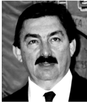
Napoleón Gómez Urrutia.

Hace dos años 65 mineros murieron en la mina de Pasta de Conchos como resultado de la negligencia e irresponsabilidad de Grupo México, la empresa concesionaria, que preside Germán Larrea, al haber omitido ésta de manera dolosa el llevar a cabo las medidas de seguridad e higiene industriales, que incluso fueron advertidas a tiempo y constantemente por los propios trabajadores, lo que dio como resultado el homicidio que se encuentra denunciado ante la Procuraduría General de la República, precisamente en contra de Germán Larrea y el Consejo de Administración de Grupo México. La tragedia ocurrió con la