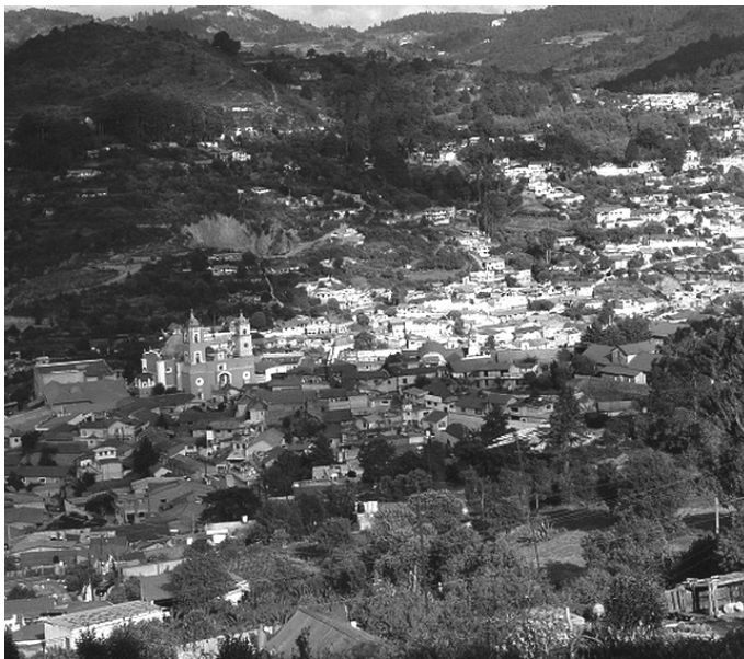
Acuerdo satisfactorio en Real del Monte

Entre otras prestaciones, en Mezcala, nuestros compañeros obtuvieron también un incremento al seguro de vida: de 55 mil a 100 mil pesos por muerte natural, y de 100 mil a 200 mil pesos por muerte en accidente de trabajo. En su conjunto, las prestaciones implicaron un aumento de 10 por ciento respecto de los niveles que mantenían en el CCT previo al revisado.