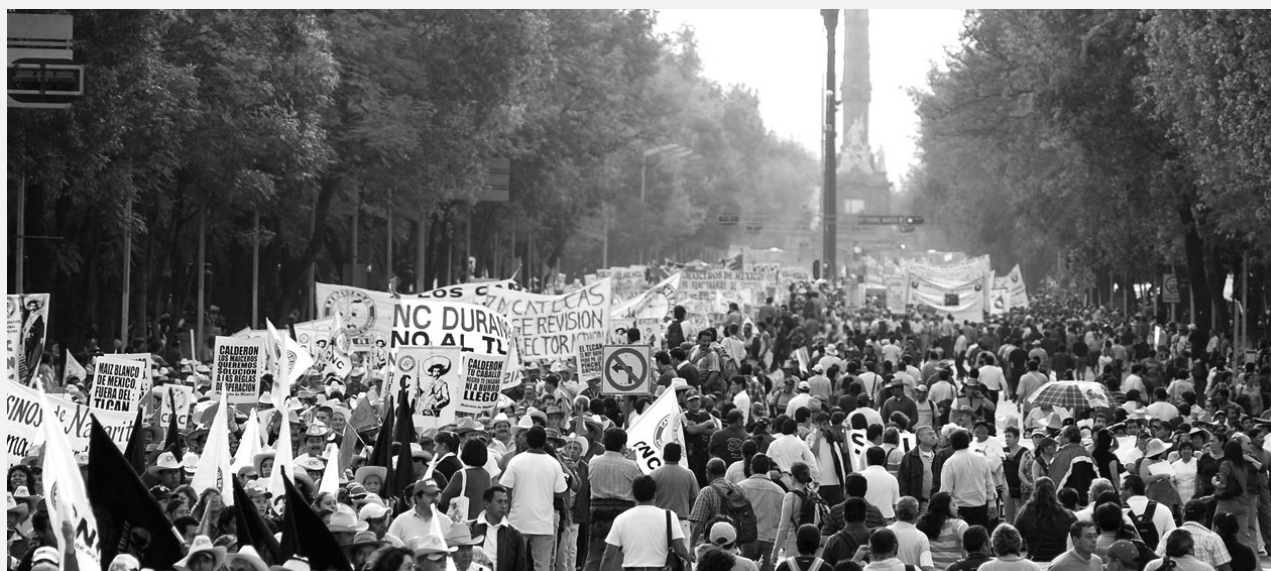
Presentes en la megamarcha del 31 de enero

El planteamiento unánime fue la resistencia obrera total contra los intentos de destruir a los sindicatos y las conquistas laborales, tarea en la que, se denunció reiteradamente, se han significado las actuales autoridades de la