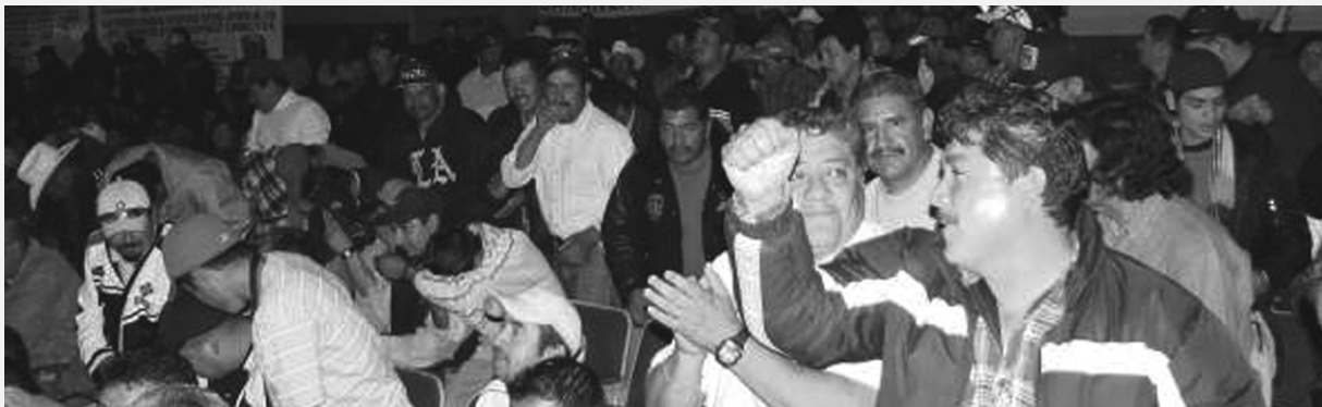
El Foro de Cananea, combatividad y entusiasmo