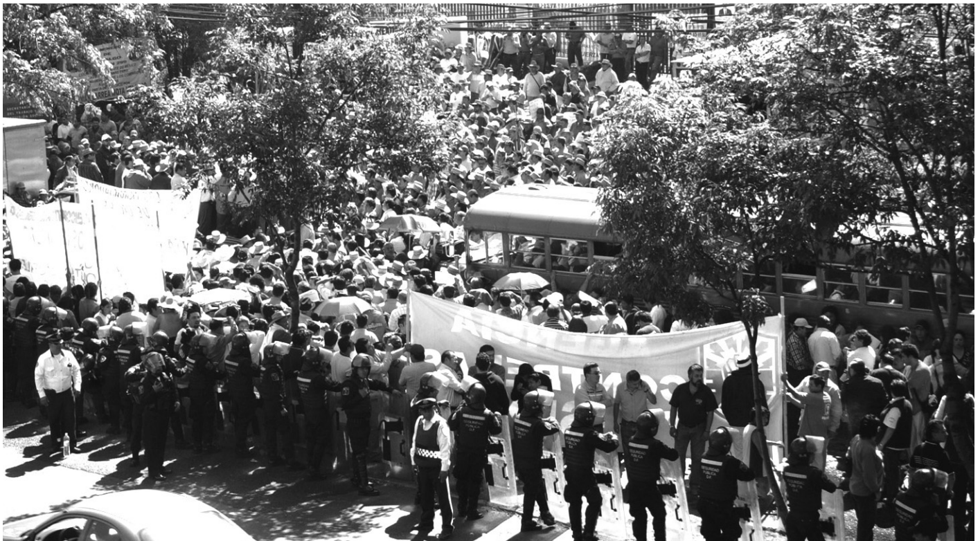
El mítin frente a la Secretaría del Trabajo fue resguardado por la fuerza pública

También se puso de manifiesto la voluntad permanente de nuestra organización para resolver las huelgas, pero Grupo México persiste en su actitud de intolerancia, cerrazón, arrogancia, mentiras y argucias legaloides para no darles solución. Incluso, como un sistema de presión, amenaza con el cierre definitivo de los centros de trabajo.